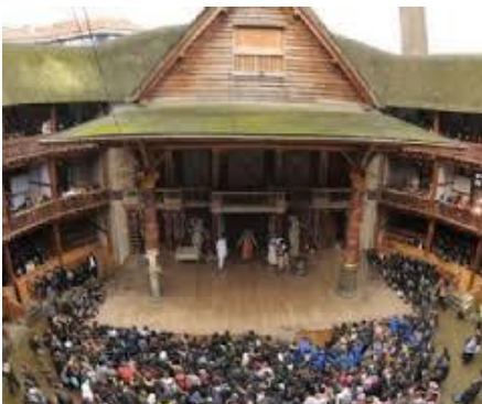
A ROMA C'è UN TEATRO "Globe" : " Il Silvano Toti Globe Theatre", che riproduce fedelmente le caratteristiche dell'antico Globe di Shakespeare