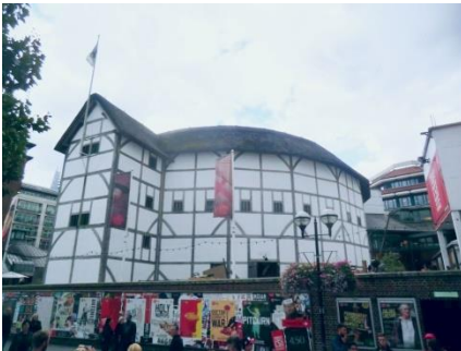
Il Globe Theatre attuale