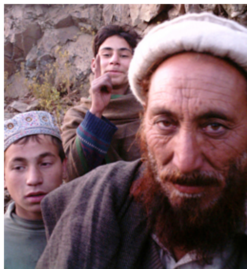
Un hombre pastún con sus hijos.

El primer estado afgano se formó en 1747, a partir de una confederación tribal pastún . Afganistán ocupó la mayor parte del territorio entre el Amu Darya y el mar de Omán. Luego, en la práctica, desapareció debido a las luchas tribales. La tensión o “Gran juego” (a mediados del siglo XIX, entre Rusia y Gran Bretaña , que nunca consiguió colonizar esas