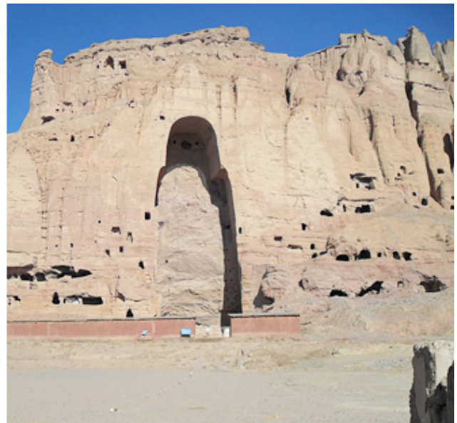
Buda de Bamiyan antes de su destrucción, por Volker Thewalt (thalpan). Y cuevas en Bamiyan sin los Budas, por Tanya Murphy (turnip!).

Las estatuas de Buda y los frescos son testimonio de la escuela Gandara , un estilo arquitectónico que mezcla la influencia griega y el budismo indio. Declaradas Patrimonio de la Humanidad por la Unesco, son una muestra de la diversidad cultural e histórica de la región. La intransigencia y el dogmatismo de una falsa interpretación del islam proclamada por los talibanes consideraron que eran ídolos y acabaron con uno de los símbolos más representativos de Afganistán. El 26 de febrero de 2001, el mulá Omar, líder del régimen talibán, ordenó la destrucción de todas las estatuas del país . Los dos Budas gigantes estallaron en pedazos el 18 de marzo de ese mismo año. En palabras de Irina Bokova, directora general de la UNESCO : " Fueron destruidos en el contexto del conflicto devastador en Afganistán y para socavar el poder de la cultura como fuerza cohesiva de los afganos ". Ahora se estudia la posibilidad de hacer una simulación por ordenador o de recomponer fragmentos, ya que es prácticamente imposible reconstruir las esculturas .