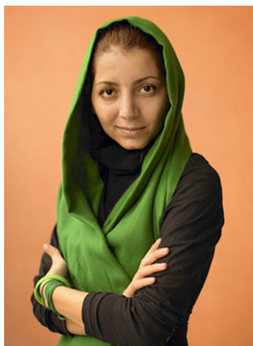
La cineasta iraní Hanna Makhmalbaf. Makhmalbaf Film House.

Tras ‘Buda explotó por vergüenza’, Hana volvió a su Irán natal. De su experiencia en las movilizaciones antes y después de las elecciones de 2009, surgió el documental ‘Los días verdes’ (‘Green Days’, 2009), censurado en el Festival Internacional de Cine de Beirut en 2011.