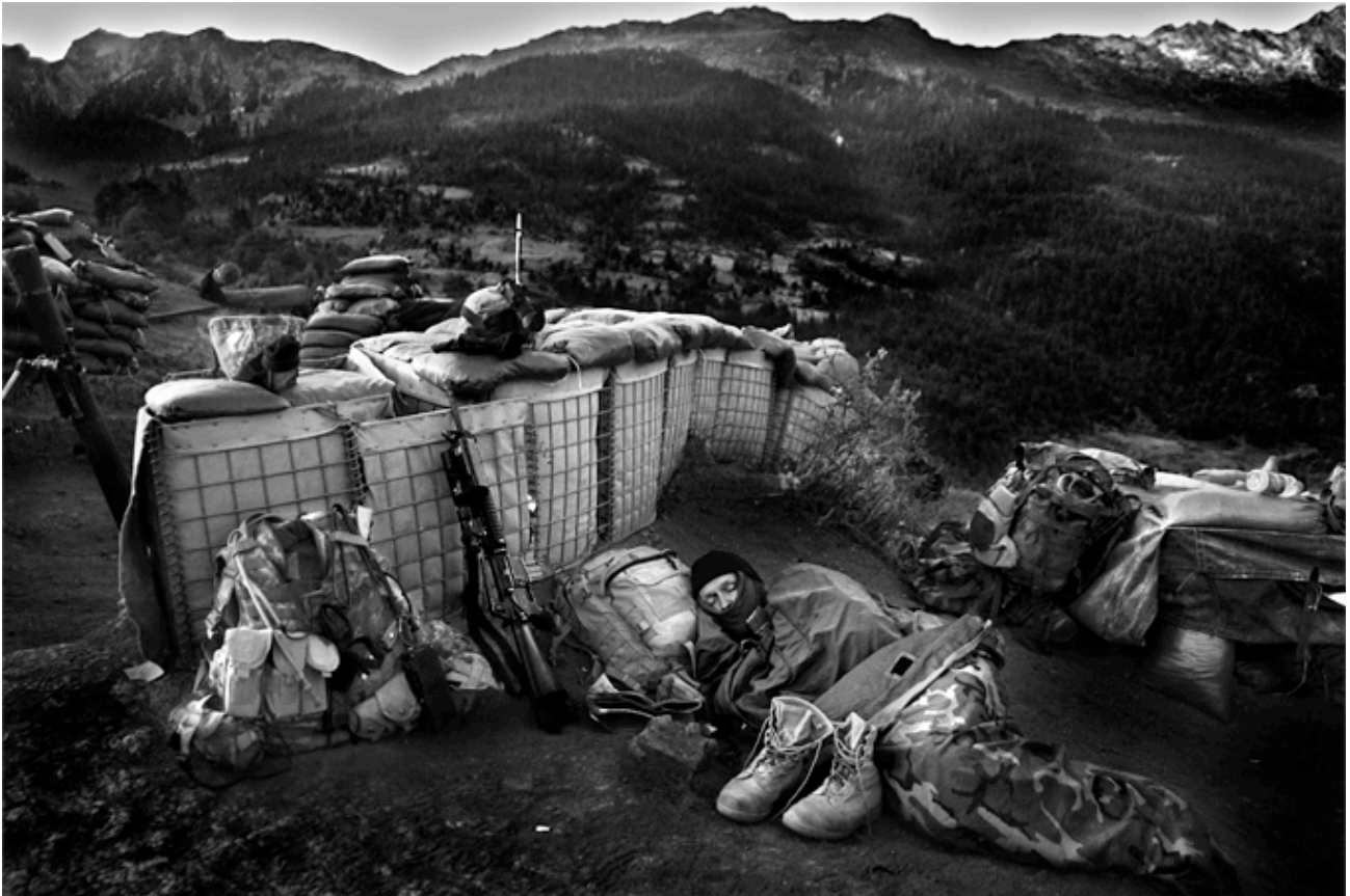
Soldados norteamericanos.

En Afganistán se libran varias batallas. Una es la insurrección de los talibanes y una federación de varios grupos yihadistas de antiguos y nuevos señores de la guerra contra el Gobierno de Kabul y la intervención extranjera . Han establecido redes de apoyo en varias zonas –sobre todo en la frontera con el norte de Pakistán- que sumadas configuran un territorio liberado, en el que han creado una administración paralela al Estado afgano.