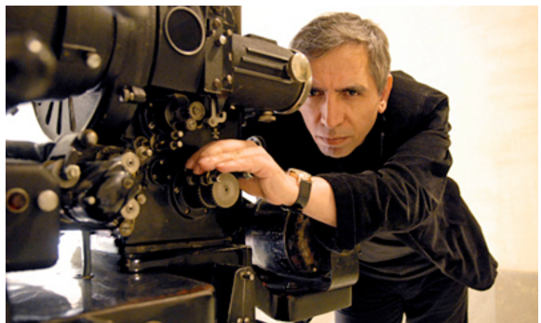
El cineasta iraní Mohsen Makhmalbaf detrás de la cámara. Makhmalbaf Film House.