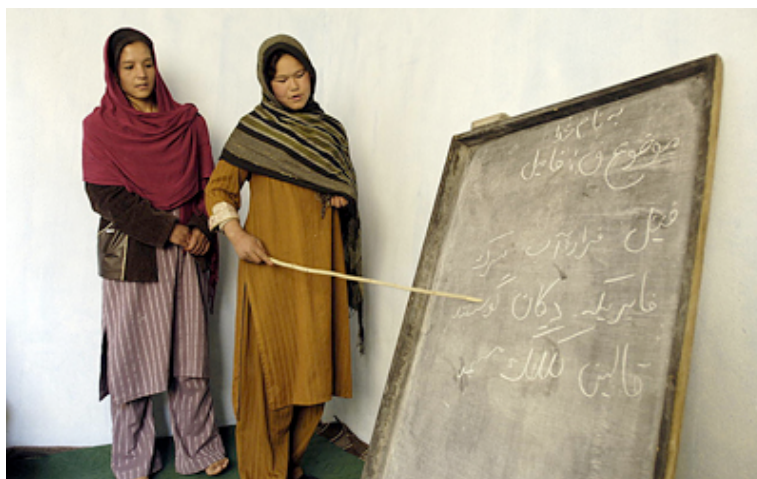
Mujeres afganas estudian en uno de los cursos apoyados por Naciones Unidas.