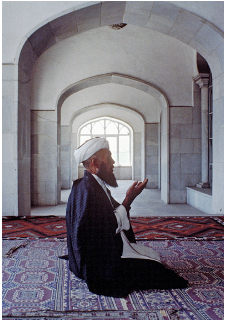
Un hombre reza en una mezquita en Kabul.

Sin embargo, en su choque con la sociedad y el Estado musulmán, que no les permite actuar políticamente, y en el enfrentamiento con los ulema , los movimientos islamistas, desde los años 80, darán prioridad a la moralización rigurosa de la vida cotidiana y a la implantación estricta de la ley islámica más arcaica .