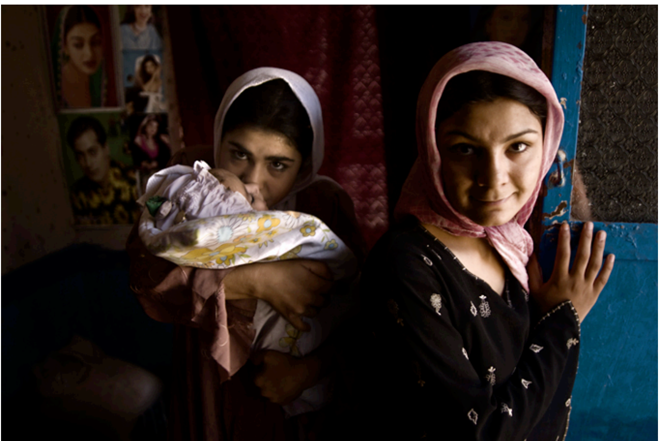
Grupo de adolescentes afganas.

Segregadas y ocultas debajo del burka, las mujeres también son víctimas en la vida cotidiana. Muchas sufren la violencia de género en los espacios públicos y en sus familias . Si nos fijamos indicadores como la salud; la violencia sexual y no sexual; los factores culturales o religiosos; los recursos económicos y el tráfico de personas; la inseguridad y la violencia ; el deterioro del sistema de salud (44 años de esperanza de vida; una de cada 11 mujeres muere en el parto) y el empobrecimiento , hacen de Afganistán el país del mundo más peligroso para las mujeres.