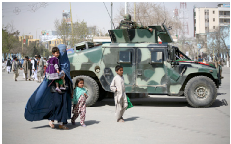
Mujer afgana con burka en la calle. Por Nasim Fekrat Afghan Lord.