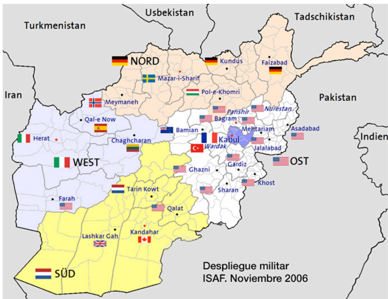
Despliegue militar en Afganistán de la ISAF en noviembre de 2006.

amigos, el escaso conocimiento de las fragmentaciones clánicas y religiosas por parte de los occidentales, los ataques indiscriminados contra la población y la ineficacia en la reconstrucción han provocado que los insurrectos consigan nuevos partidarios.