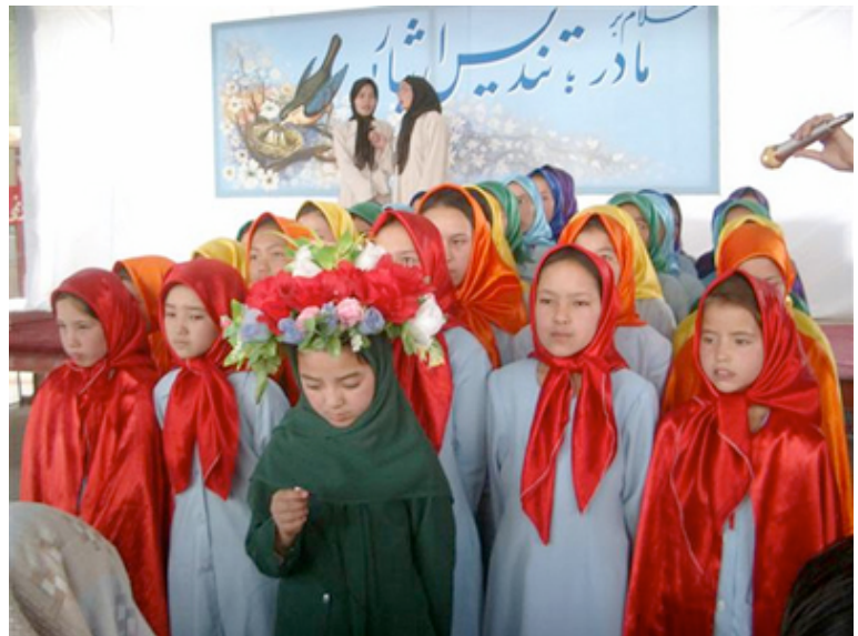
Niñas hazaras en la escuela, Kabul.

La situación de la población hazara ha mejorado después del derrocamiento de los talibanes en 2001. Sus gentes pueden acudir a las universidades y disponer de trabajos a los que antes no podían acceder. Sus tierras apenas tienen campos de amapolas, destinados a la droga. Representan el 40% de la población de Kabul y un porcentaje significativo forma una cierta clase media. Hazaras han sido uno de los vicepresidentes del país y el parlamentario que logró más votos en las elecciones. Además, muchas mujeres hazaras figuran entre los sectores sociales más avanzados de Afganistán: no visten el burka, sino trajes tradicionales de colores, y se han incorporado a la enseñanza, la medicina y la política. Hazara es la primera y única mujer gobernadora , en este caso Habiba Sarobi , antes ministra para los Asuntos de las Mujeres y desde 2005 al frente de la provincia de Bamiyán durante cinco años.