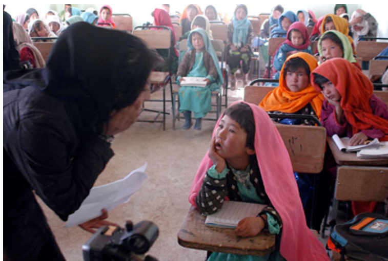
Hana Makhmalbaf da instrucciones a las niñas de la escuela.

En opinión de Lola Santos Priego (2) , la trama sigue la estructura clásica del viaje y de la fábula tradicional: