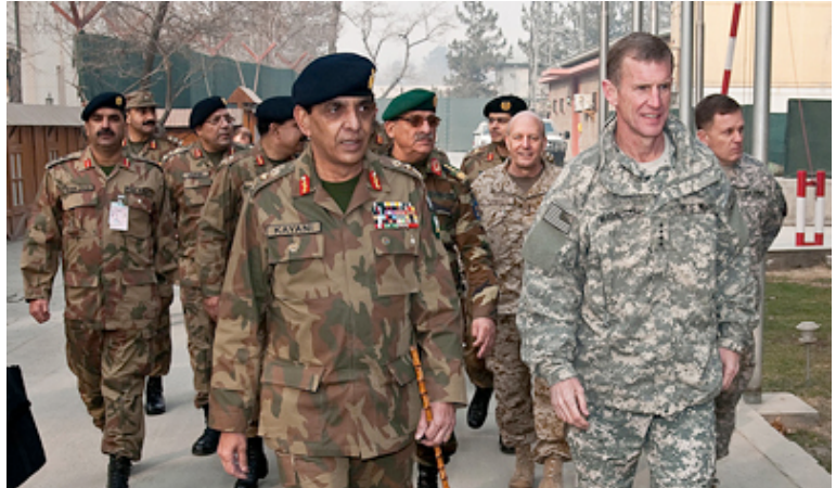
El general Parvez Kayani, jefe del Estado Mayor del Ejército de Pakistán y el general McChrystal, comandante de la OTAN.

Al cabo de los años hasta la actualidad, los talibanes han recuperado protagonismo y territorio . Nunca desaparecieron, sino que se mezclaron con los habitantes y se fundieron con el paisaje, a la espera de una relación de fuerzas favorable. Los talibanes se han reforzado y confluyen con otras fuerzas. Desde 2010 actúan ya en 30 de las 34 provincias del país. Han sido capaces de infiltrarse en las fuerzas de seguridad, formar unidades especializadas (el Lashkar Al-Zil o Ejército de la sombra, junto a los talibanes