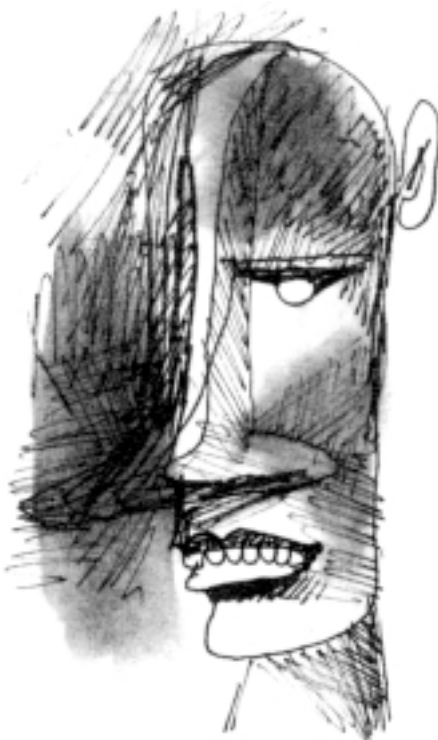
Germán Londoño: Libretas de apuntes.

el sector de servicios y sus tareas profesionales, de ocio y de estudio, siempre presentaron fronteras difusas). Para nosotros, existen dos problemas adicionales: el mantenimiento de las relaciones de poder entre el conocimiento válido de unos (científico-técnico) y el no-conocimiento o doxa de los otros (que deben ser disciplinados o excluidos, o incluidos segmentadamente), ahora mantenidas a través de nuevos mecanismos de producción de di-