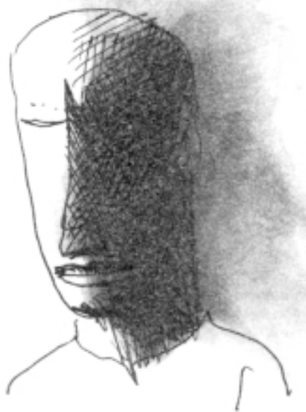
Germán Londoño: Libretas de apuntes.

Lo anterior nos lleva a plantear con Valderrama (2008) que el ciberespacio es efectivamente un campo de lucha donde la esfera pública (en ese borroso intersticio de lo privado-pú-