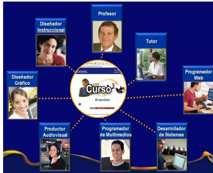
Figura 6. Celda de producción de cursos