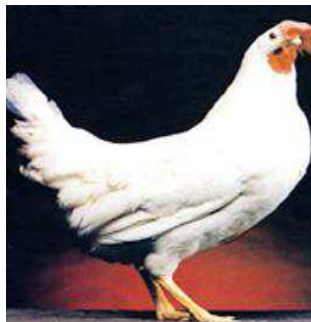
LIVIANAS O BLANCAS

Características: Delgadas de porte elegante, de temperamento nervioso, plumaje blanco, los machos son de crecimiento y emplume rápido, las hembras rara vez encluecan y los huevos que producen incuban fácilmente, el peso en el macho adulto es de 2.7 kgs y la hembra adulta es de 2.0 kgs y producen huevos de cáscara blanca.