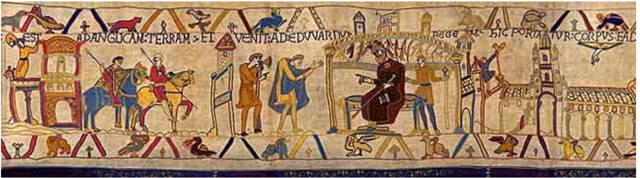
26. Hic portatur corpus Eadwardi regis ad ecclesiam S(an)c(t)i Petri ap(osto)li. Qui, il corpo del re Edoardo è portato nella chiesa di san Pietro Apostolo.