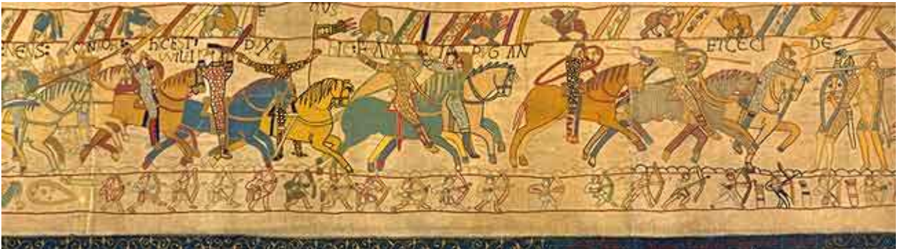
56. Hic Franci pugnant et ceciderunt qui erant cum Haroldo. Qui, i Francesi combattono e coloro che erano con Aroldo caddero.