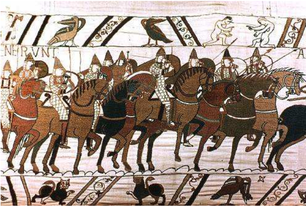
49. Hic Willelm dux interrogat Vital si vidisset exercitu(m) Haroldi. Qui, il duca Guglielmo chiede a Vitale se abbia visto l'esercito di Aroldo.