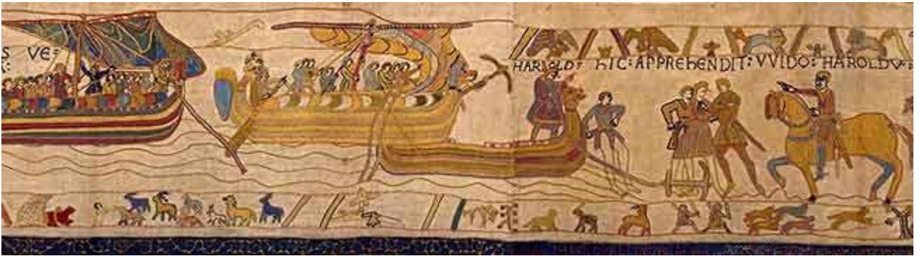
8. Et duxit eum ad Belrem et ibi eum tenuit. E lo conduce a Beaurain, dove lo tiene di forza.