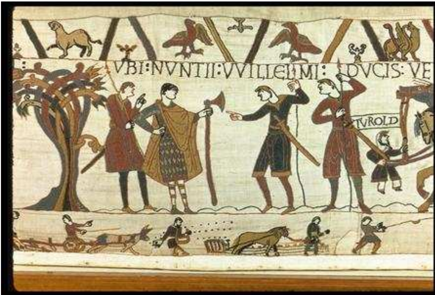
11. Nuntii Willelmi . I messi di Guglielmo.