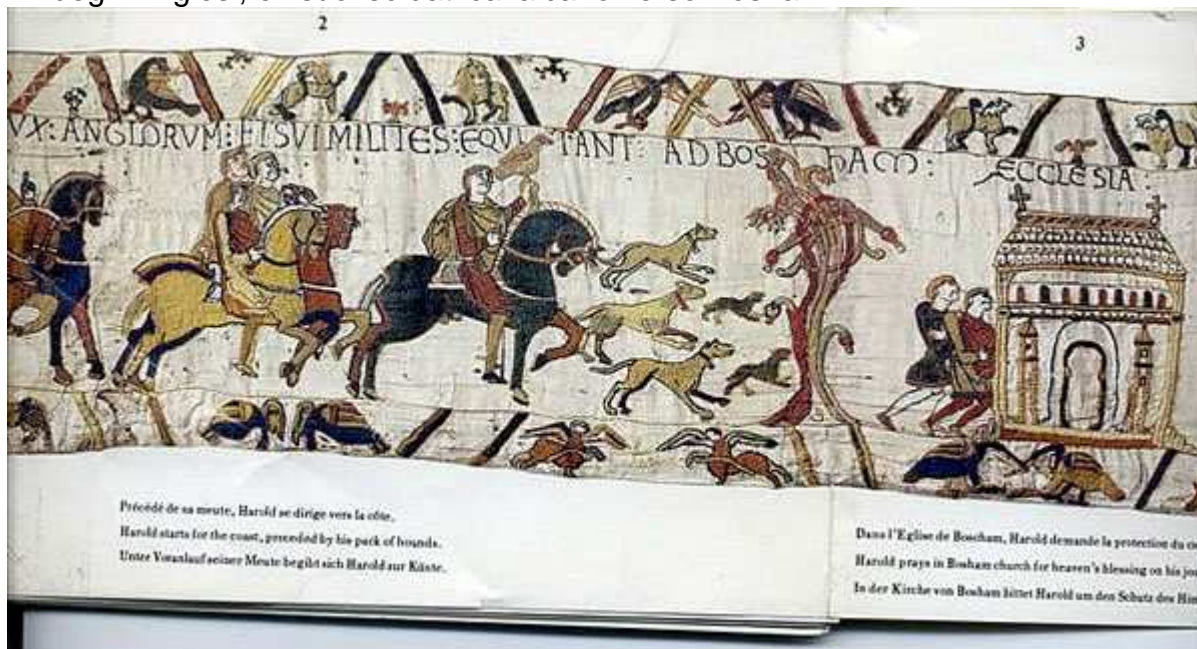
3. Ecclesia. Una chiesa.