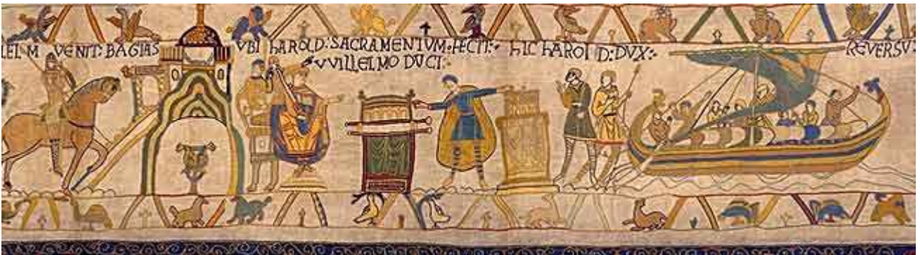
23. Ubi Harold sacramentum fecit Willelmo duci. Dove Aroldo prestò giuramento al duca Guglielmo.