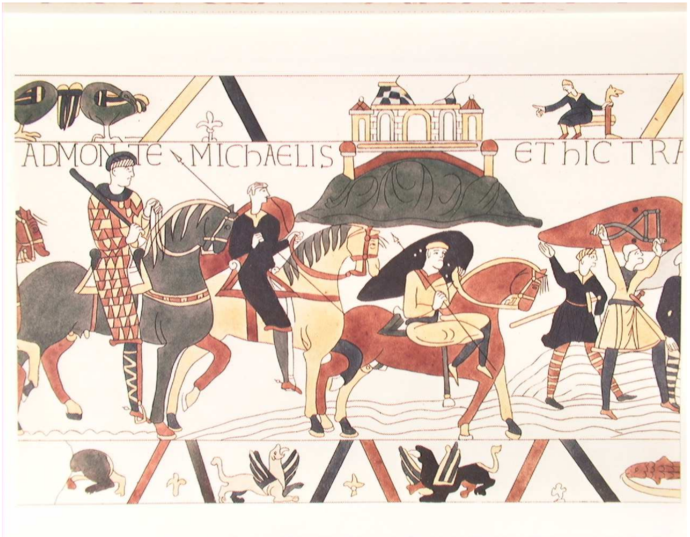
17. Et hic transierunt flumen Cosnonis. Hic Harold dux trahebat eos de arena. E qui attraversarono il fiume Couesnon. Qui il duca Aroldo estraeva (i soldati) dalle sabbie mobili.