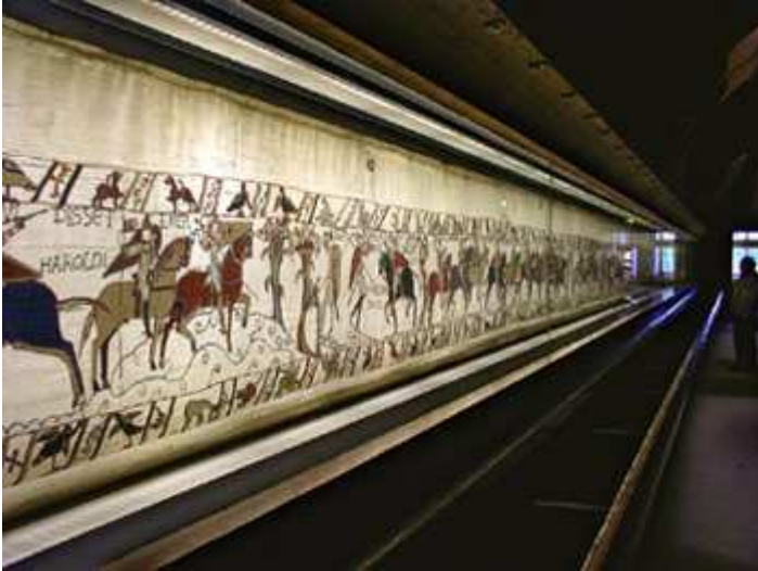
1. Edward rex. Il re Edoardo.