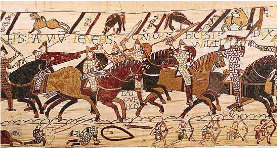
55. Hic est Willel(m) dux. E(usta)tius. Qui c'è Guglielmo. Eustazio.