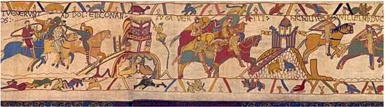
19. Hic milites Willelmi ducis pugnant contra Dinantes. Qui, i soldati del duca Guglielmo attaccano Dinan.