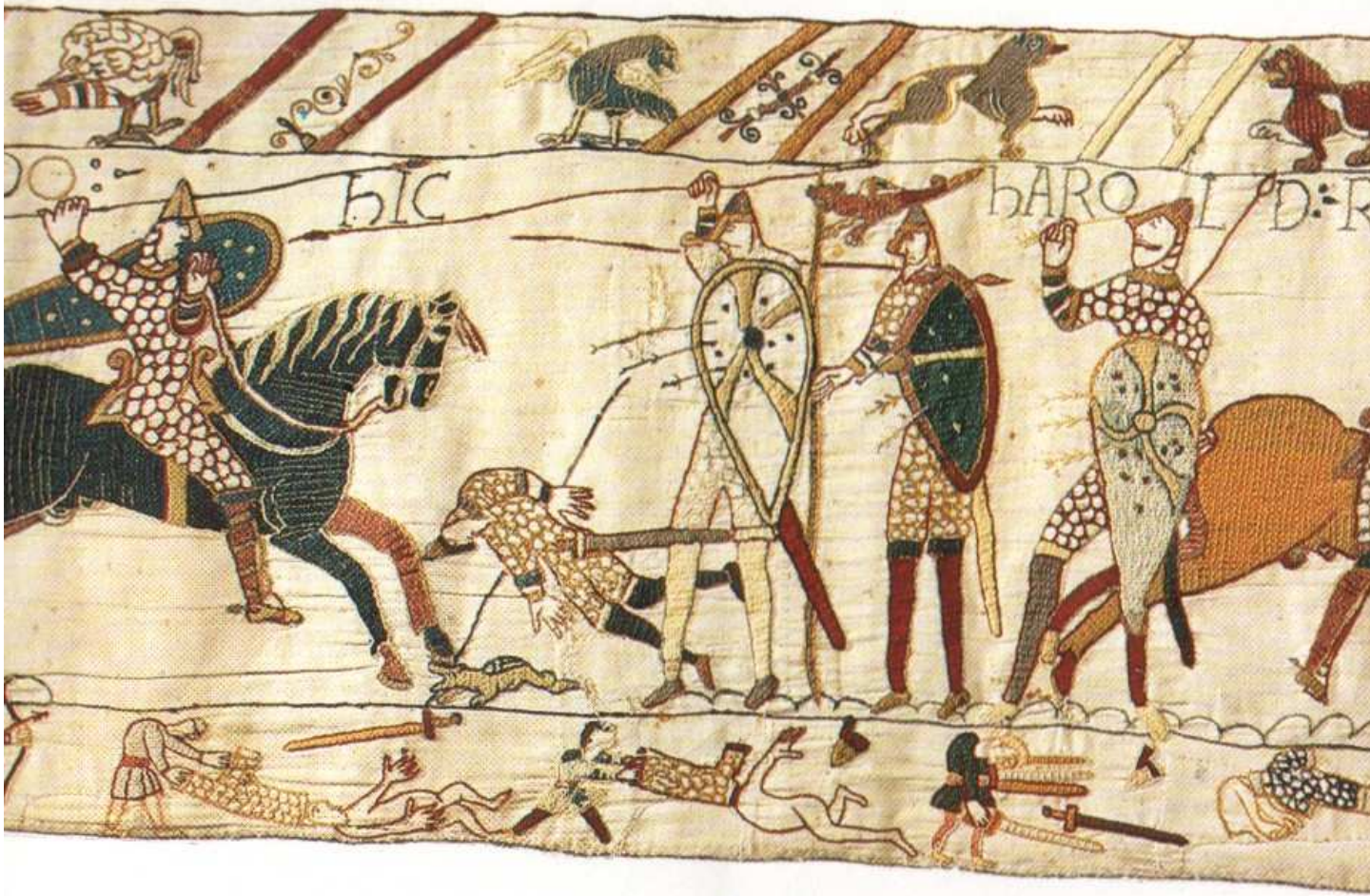
58. Et fuga verterunt Angli. E gli Inglesi si diedero alla fuga.