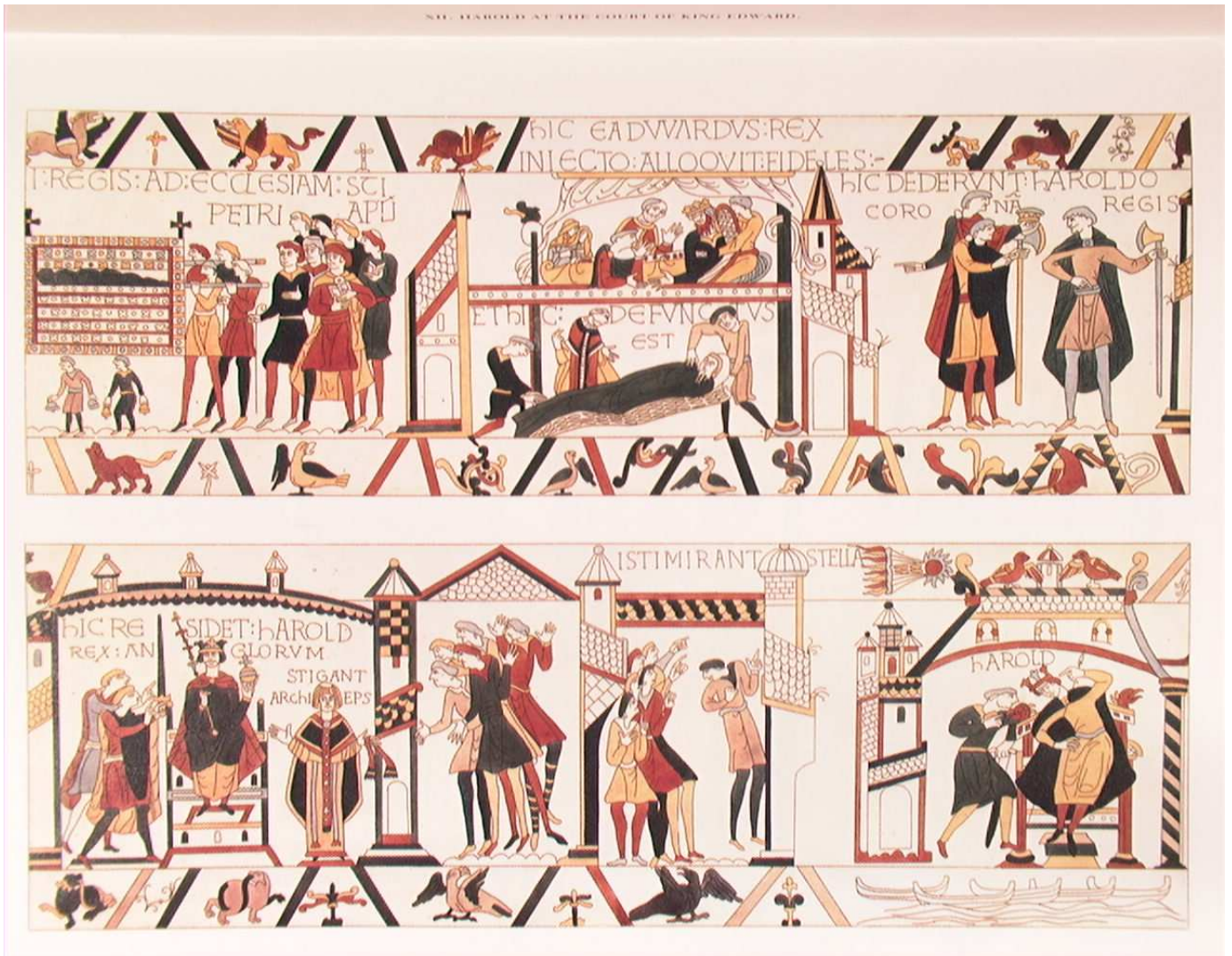
29. Hic dederunt Haroldo corona(m) regis. Qui hanno dato la corona reale ad Aroldo.