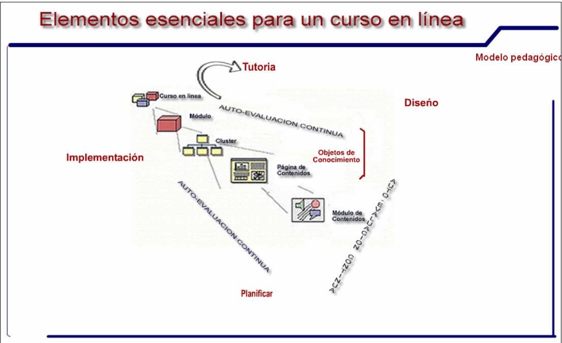
Figura. 3 Elementos esenciales para un curso en línea

Vale la pena resaltar el trabajo colaborativo que generó aportes valiosos para la creación de conocimiento alrededor de temas como el de los elementos esenciales para un curso en línea (figura 3).