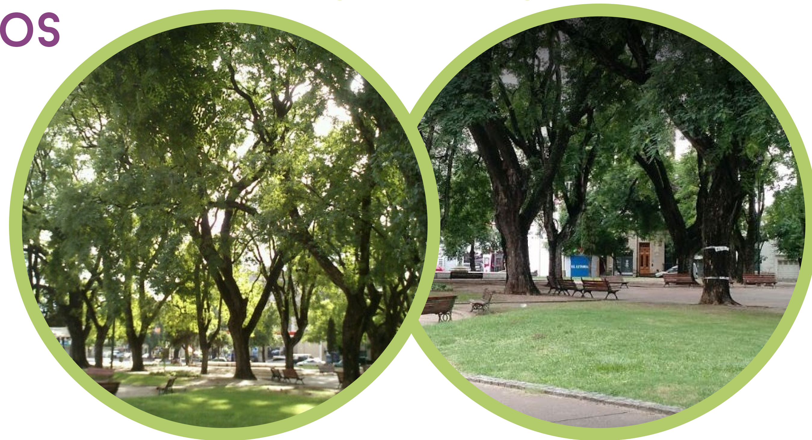
ESCENARIO 2: ESPACIOS VERDES- MOBILIARIO