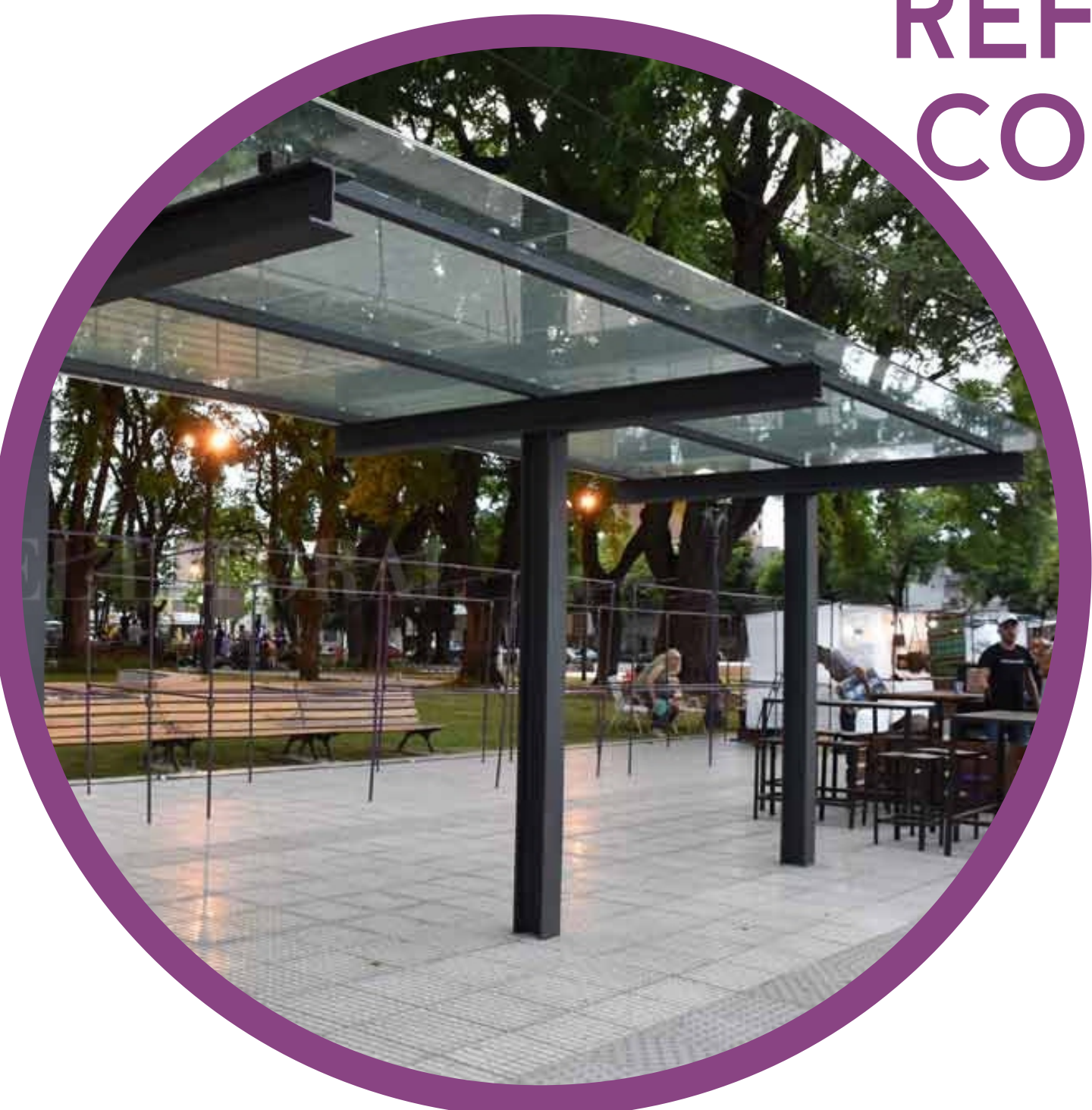
ESCENARIO 6: REFUGIO DE COLECTIVOS