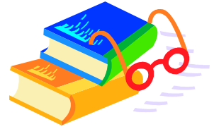
Table des matières et Numérotation