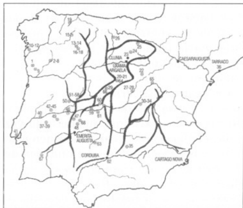
Mapa de distribución de emigrantes de Clunia y Vxama. Los trazos negros corresponden a las cañadas mesteñas tradicionales.

De todas maneras, armado de paciencia, recorriendo diversas comarcas y preguntando a gente mayor que se dedicó al pastoreo, se consiguieron datos muy interesantes sobre los restos de la memoria, que considero se puedan presentar en el