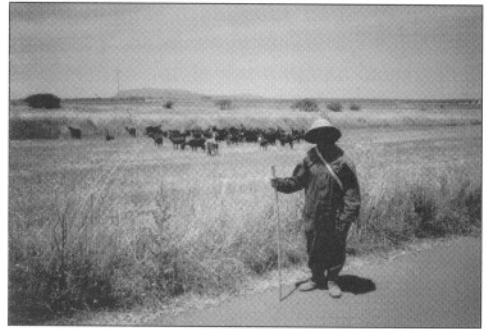
El pastoreo actual se mantiene gracias a la contratación de latinoamericanos.

Durante los siguientes siglos XIV y XV, la Mesta perfiló su estructura de forma paralela al desarrollo de la trashumancia, siendo Alfonso XI El Justiciero, quien le otorga nuevos privilegios, que continuaron con Enrique II, bajo cuyo mandato se efectuó la primera compilación de leyes de esta Institución. Llegado este instante, se advierte públicamente que el ganado que se hallaba bajo la jurisdicción de la