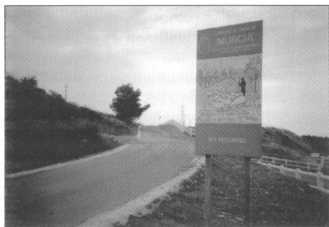
Vereda de los Valencianos a su llegada a Carrascoy.

buyen privilegios regios, que se fundamentan en la libertad de paso para el ganado y por extensión la conservación de sus caminos a los que se les dio título real. Sabiamente, como así ha demostrado la historia que ha sucedido a dicho Rey, tomo la decisión acertada, en función de fundar una de las empresas económicas que más adelante se convertiría en uno de los pilares cimeros del comercio castellano en Europa, la lana del ganado merino español. De tal forma que el gremio ganadero de la Mesta, alcanzaría su máximo esplendor, toda vez que actuaría como uno de los grandes poderes europeos, dominando la producción del esquila de la esencial materia prima, e incorporando firmemente la organización al entramado económico y financiero del continente, con intensa influencia en los asuntos internos de las naciones suministradas.