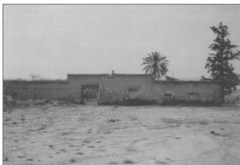
Restos de una edificación de hospedaje y establo en la Vereda de los Valencianos.

a Oeste, o en sentido inverso, completando una extraordinaria red arterial que ha sido aprovechada intensamente para todo tipo de transporte, siendo origen en muchos casos, como finalidad para insertar la actual red de carreteras y autopistas.