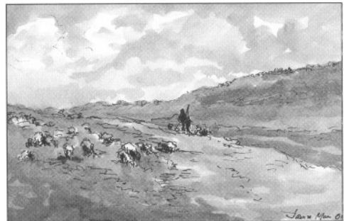
"Pastoreando por Fuente Caputa". Yechar. Mula.

En cualquier caso, recurrir al conocimiento inicial de la trashumancia en nuestra tierra, habría que fijarlo en palabras del historiador, al conjunto de inercias trashumantes complejas, anteriores a la Mesta, que después generalizó sobre la riqueza pecuaria, íntimamente unida al