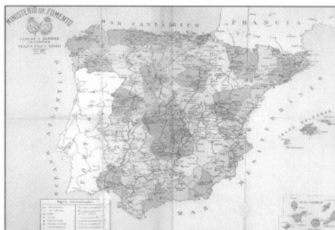
Mapa de V.P. del Ministerio de Fomento. Año 1925.

Pero la complejidad orgánica, desde el primer instante, exigió puntualizar y matizar el contexto del argot distributivo de la cabaña, con la manifestación de un lenguaje y control aritmético, que se implantaría para ejercer la actividad del oficio. Por tanto la cabaña, en el aspecto numérico, se descompondría en rebaños que regularía una cifra de hasta mil cabezas en las ovejas, y de seiscientas a ochocientas en los carneros, donde a su vez cada rebaño estaba a cargo de cinco pastores, que se les nombraba en función de su experiencia: rabadán (que podía ser el Mayoral), compañero (hombre de confianza), ayudador (pastor que ocupaba el primer lugar después del Mayoral), sobrado (joven audaz y atrevido) y zagal (pastor mozo a las órdenes del rabadán),