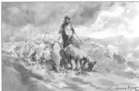
"El pastor viajero y mensajero".

Evidentemente, por el contrario, no esta probado en nuestra cuenca, al igual que en el resto de la península, los grandes movimientos semovientes de larga longitud anterior a la época visigoda. Resultaría